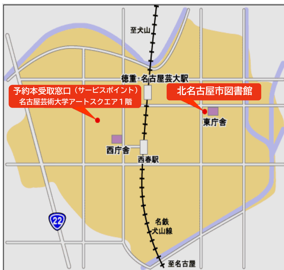
図 書 館 年 報 令和6年度実績