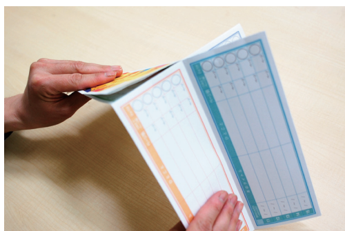
⑦ ⑥をたて半分に折る。