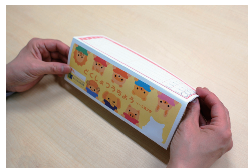
⑨ ⑧をよこ半分に折って完成!