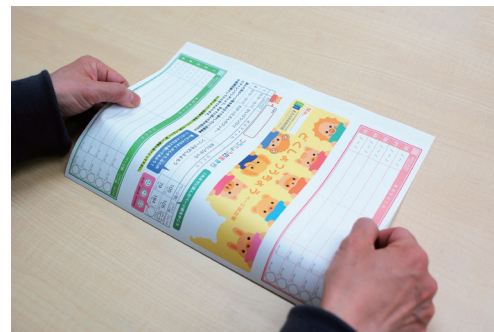
① たて半分に折り目をつける。