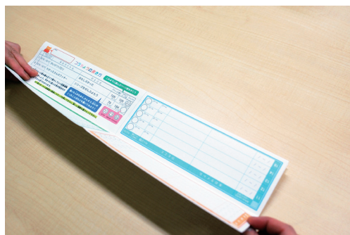
④ 裏側も同じように折る。