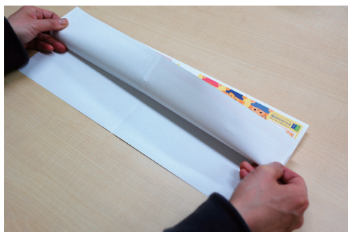
③ ②をさらによこ半分に折る。