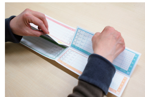
⑥ ミシン目にそって切る。